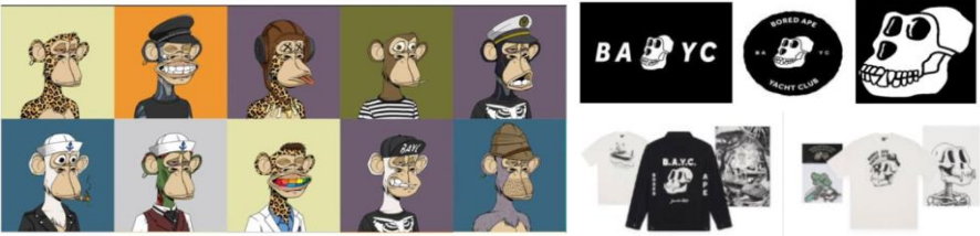
第 9 巡回区連邦控訴裁判所 判決文 p.10, 11 より

ションを完売させ、初回販売で 200 万ドル超の収益を得た。BAYC NFT の購入者は、当該イラストの個人的・商業的利用権を無償で取得するとともに、デジタル空間やリアルイベントへの参加資格を有する会員制コミュニティの一員となる。Yuga は、「BORED APE YACHT CLUB」、「BAYC」等の名称やロゴを用いて BAYC をブランド化し、著名人の支持や企業とのコラボレーションを通じて、その価値と知名度を急速に高めていった。以下は、BAYC の Bored Ape 図形及び使用商標の一例である。