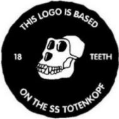
第 9 巡回区連邦控訴裁判所 判決文 p.12 より